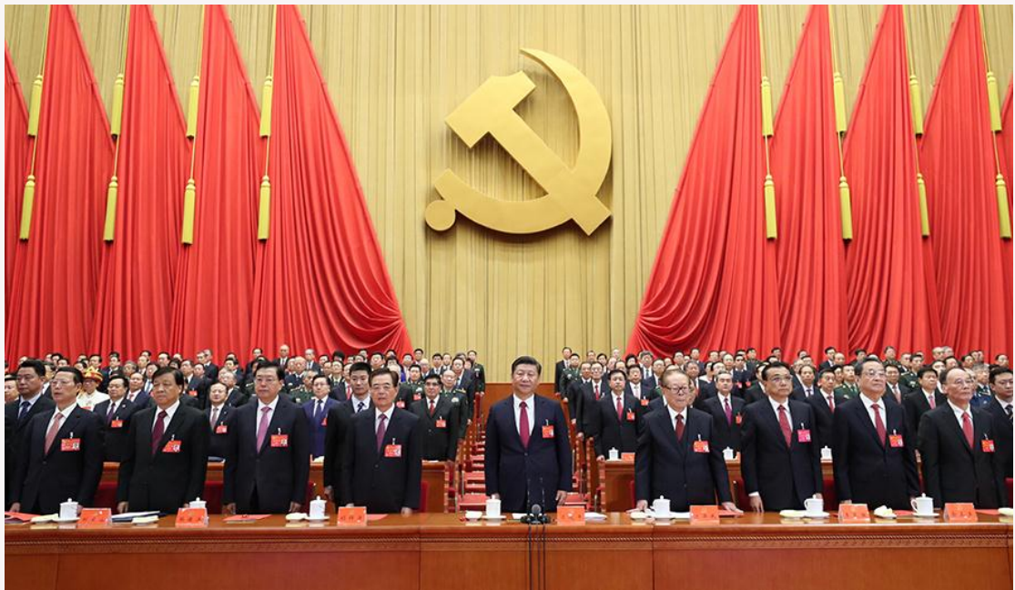
10 月 24 日，中国共产党第十九次全国代表大会在北京人民大会堂胜利闭幕。这是习近平、李克强、张德江、俞正声、刘云山、王岐山、张高丽、江泽民、胡锦涛在主席台上。

习近平、李克强、张德江、俞正声、刘云山、王岐山、张高丽、马凯、王沪宁、刘延东、刘奇葆、许其亮、孙春兰、李建国、李源潮、汪洋、张春贤、范长龙、孟建柱、赵乐际、胡春华、栗战书、郭金龙、韩正、江泽民、胡锦涛、李鹏、朱镕基、李瑞环、吴邦国、温家宝、贾庆林、宋平、李岚清、曾庆红、吴官正、李长春、贺国强、杜青林、赵洪祝、杨晶等大会主席团常务委员会成员在主席台前排就座。